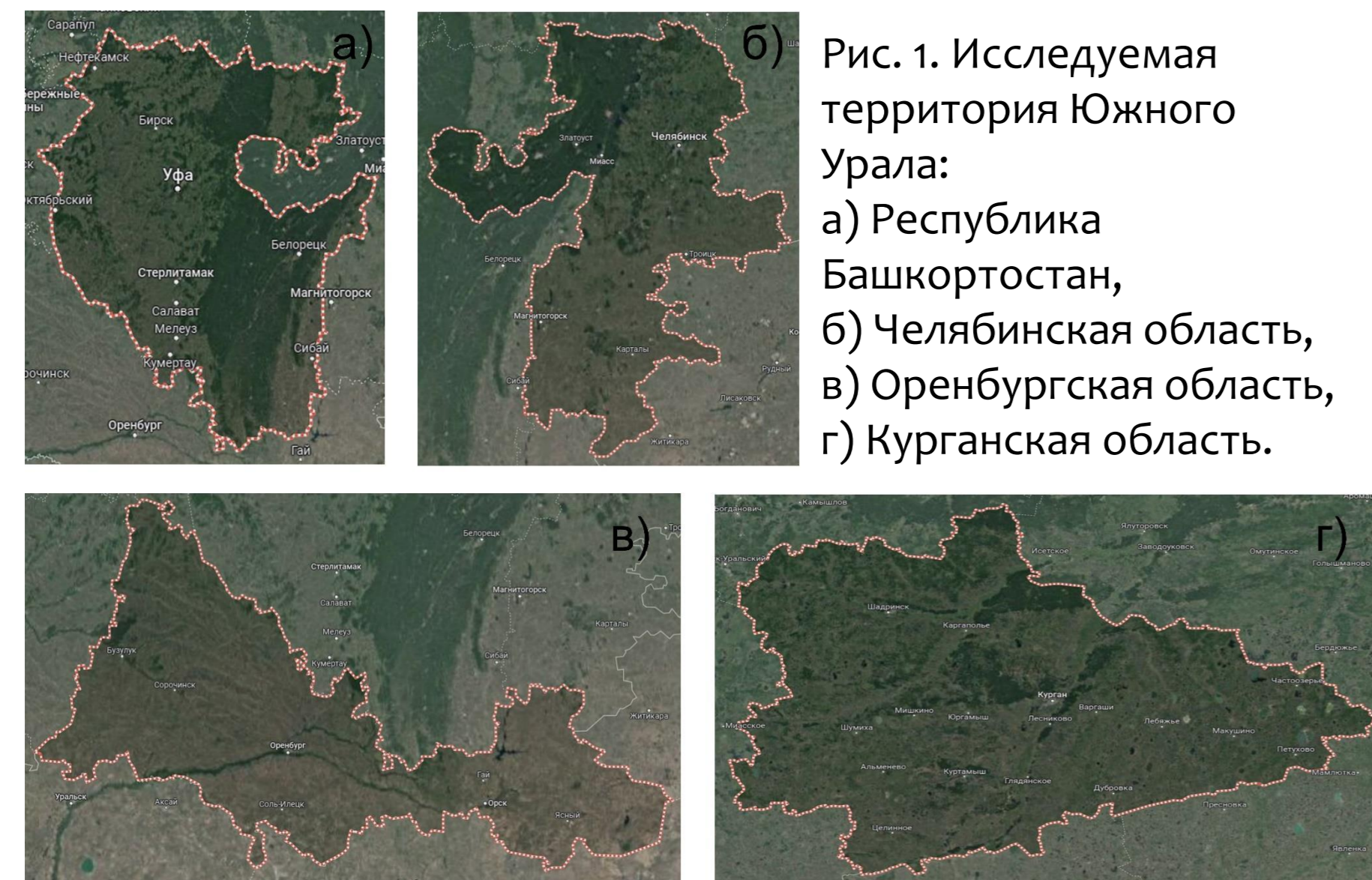
Рис. 1. Исследуемая территория Южного Урала: а) Республика Башкортостан, б) Челябинская область, в) Оренбургская область, г) Курганская область.

Южный Урал это крупный промышленный регион страны, включающий в себя Республику Башкортостан, Челябинскую, Оренбургскую и Курганскую области (Рис. 1). Промышленные предприятия городов и лесные пожары в горнолесной зоне Южного Урала влияют на концентрацию атмосферных примесей в регионе. В настоящее время спутниковое зондирование активно используется для мониторинга метеорологических условий, химического состава атмосферы и лесных пожаров. Выбросы промышленных предприятий и лесные пожары не только оказывают влияние на уровень загрязнения воздуха, но распространяются в атмосфере на большие расстояния. Цель настоящей работы состояла в исследовании сезонных вариаций концентрации атмосферных примесей CO, O 3 , HNO 3 и H 2 O в нижней атмосфере над территорией Южного Урала.